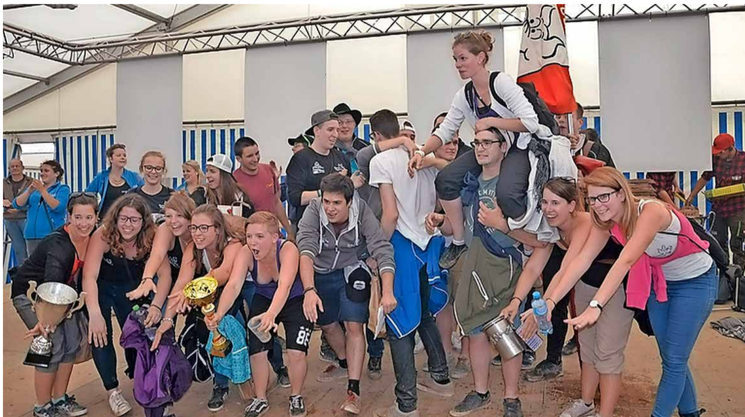
La Jeunesse de Payerne a de quoi fêter après sa 1 re place au Rallye et ses bons résultats.

7 de la Fédération des jeunesses campagnardes a réuni plus de 20000 personnes.