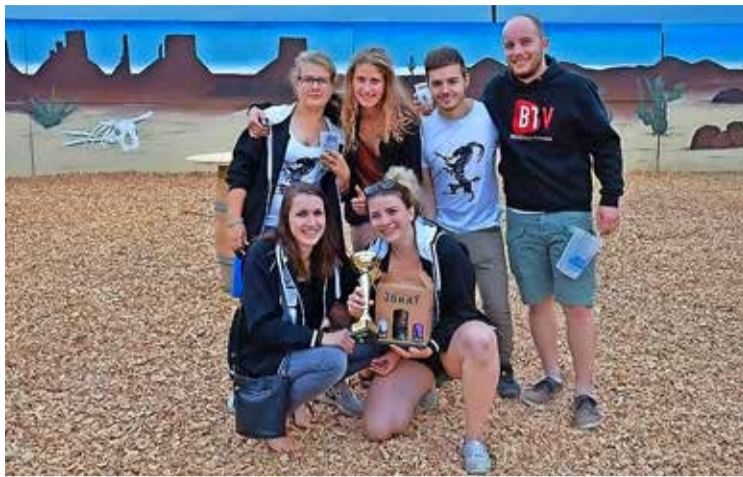
La Jeunesse de Chevroux décroche la 2 e place au concours de chaises musicales du mercredi soir.