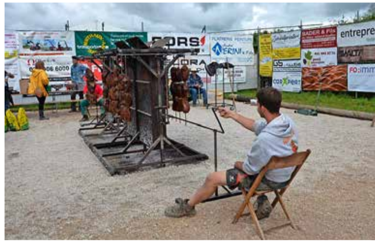
Une broche géante attendait les cow-boys dimanche à midi.